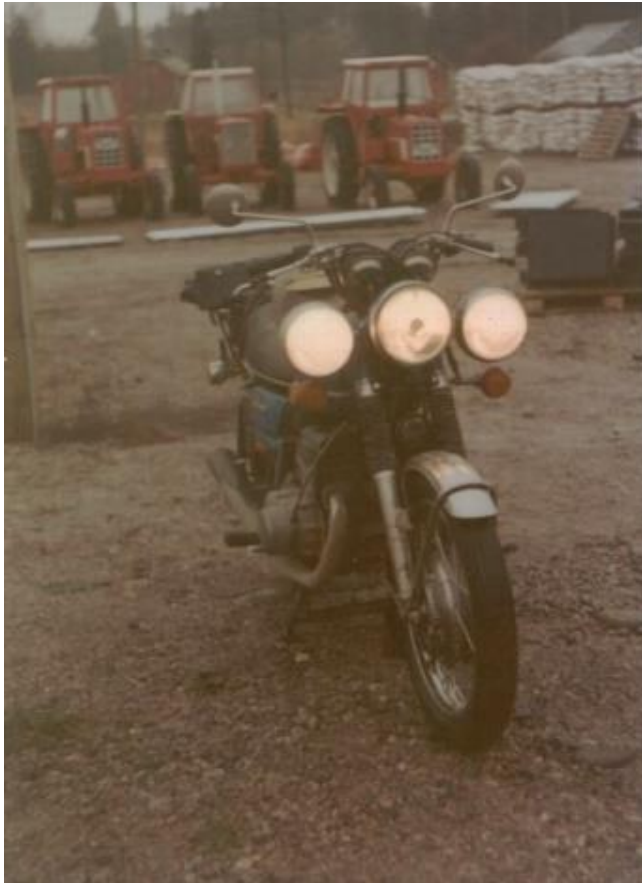
CIBIË – HELLA - CIBIË

Olin "virittänyt"; customoinut pyöräni nimeten sen LFE -versioksi: