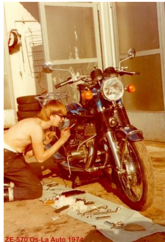
ZE-570 Os-La Auto 1974