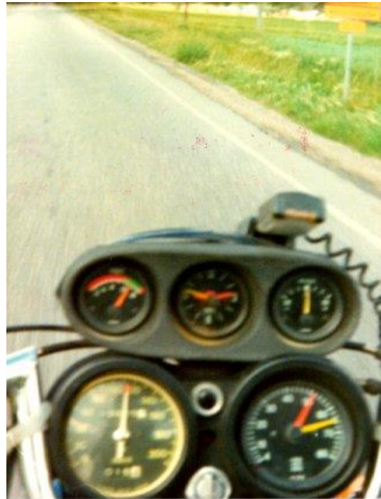
Pokkarikuva AGFA 5000 Hesan tiellä VT7 [170TIE]

takavallo jonka oli hopeateipannut Bling-Bling'iksi ;-)